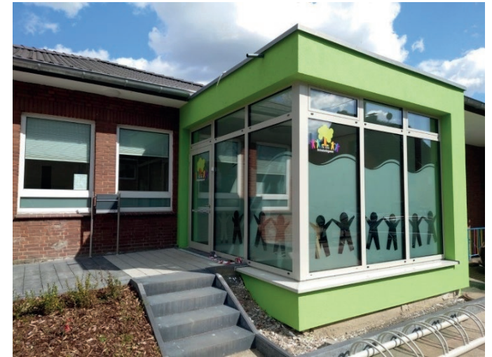
Kita Schmiedegasse, Walsum-Vierlinden

In 2024 wurden im Zuge der Sanierung in 2023 Schutzmaßnahmen zur Verhinderung von Wassereintritt getroffen. Die Außenwände wurden zusätzlich isoliert und außenführende Wasserleitungen wurden erneuert.